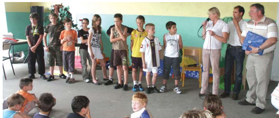
Les élèves quittant le CM2 pour entrer en 6 ème ont été à l'honneur.