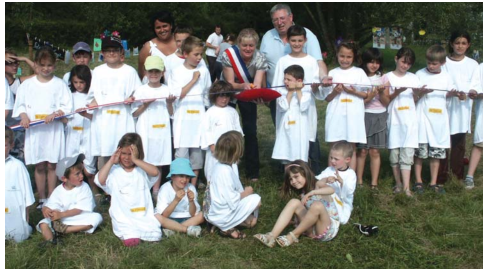
Le moment solennel du ruban tricolore...

Dans le cadre du projet «Naturaville», les enfants participant aux activités des Francas ont inauguré leur verger.