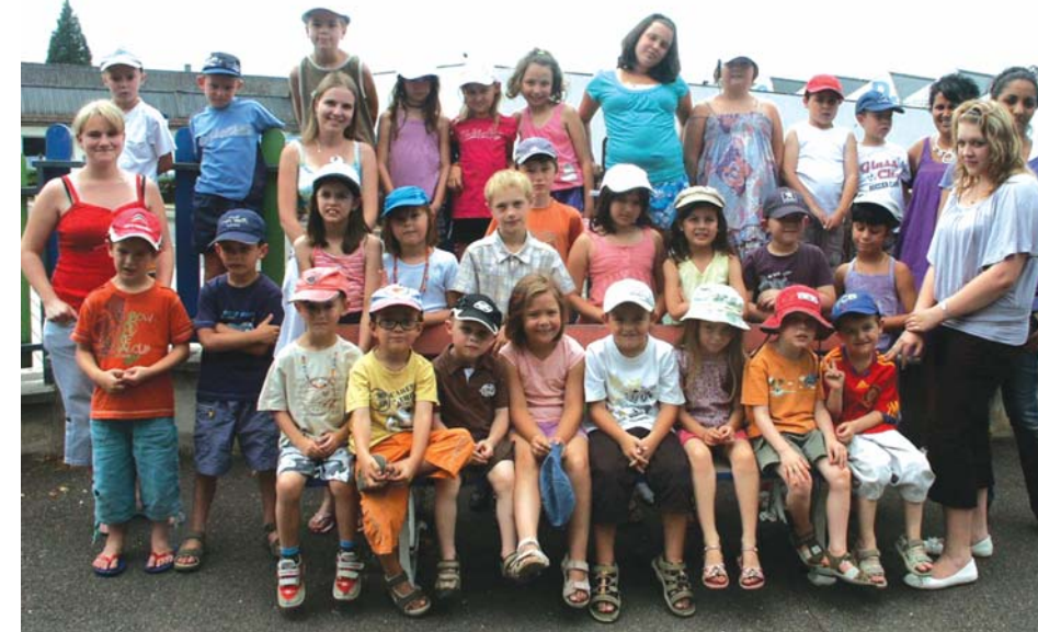
Un mois de juillet actif et varié pour les enfants d'Arbouans.