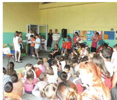
Toutes les classes ont offert un petit spectacle aux parents d'élèves.