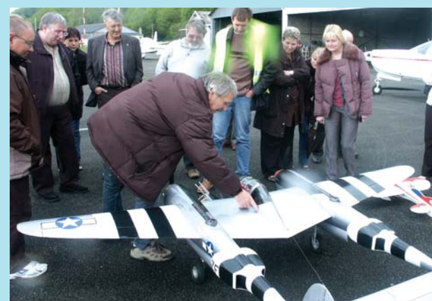
Le club d'aéromodélisme a également pu présenter ses activités.

«hélicoptère», ce qu'ont parfaitement réfuté les responsables de l'aérodrome, assurant que cette tâche était assurée avec l'aide de déneigeuses. Quant aux moteurs des avions «qui chauffent longtemps avant le décollage», c'est tout simplement une nécessité, dans la mesure où ce type d'engin n'est pas un scooter et que la réglementation impose certaines procédures. Finalement, il est apparu que les problèmes les plus gênants pour les riverains correspondent aux activités du club d'aéromodélisme. Les gros avions ne font que passer... mais les petits «tournent en boucle» sur le secteur,