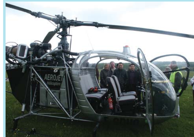
L'hélicoptère a suscité de la curiosité...

Grande première le 15 mai dernier : les habitants d'Arbouans ont été invités à découvrir les «entrailles» de l'aérodrome de Courcelles, un équipement qui ne manque pas, parfois, de faire débat parmi la population. En fait, deux problématiques s'opposent, l'enjeu économique du développement de l'aérodrome et les nuisances sonores liées à son activité. Les élus d'Arbouans, soucieux du bien-être et du confort de vie de leurs administrés, ont souhaité faire un «état des lieux», recueillir les témoignages et écouter les doléances des habitants,