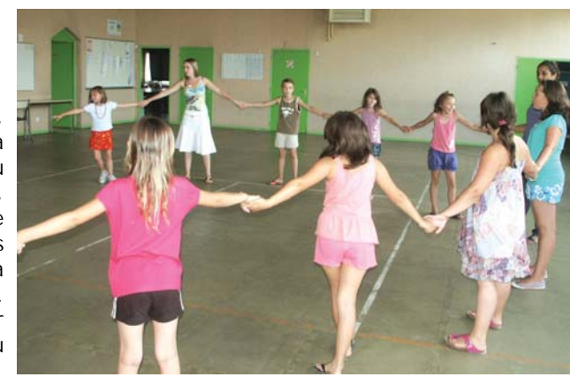
Des jeux divers ont également rythmé le quotidien des enfants du Centre de Loisirs d'Arbouans.

Entre le 5 et le 30 juillet, ces enfants âgés de 3 à 11 ans ont donc connu une période active, avec notamment toute une série d'animations sur le thème de la découverte du Far-West. Ainsi, ils ont pu s'initier à la danse country ou découvrir l'équitation. Pour le reste, le Centre a été rythmé par les