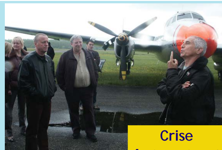
Les élus d'Arbouans attentifs aux explications des pilotes...