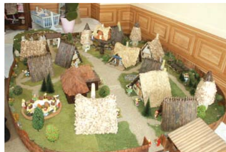
Le village d'Astérix et des irréductibles Gaulois : il ne manque que les bruits...