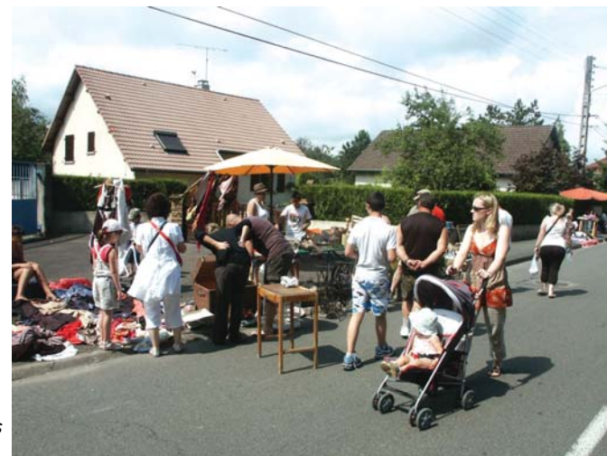
La Brocante des footballeurs a bénéficié d'une météo favorable.

Une belle journée en somme, tant pour les exposants que pour les acheteurs.