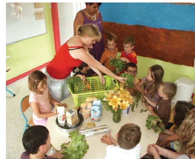
Atelier cuisine pour les enfants après leur journée cueillette à Arcey.