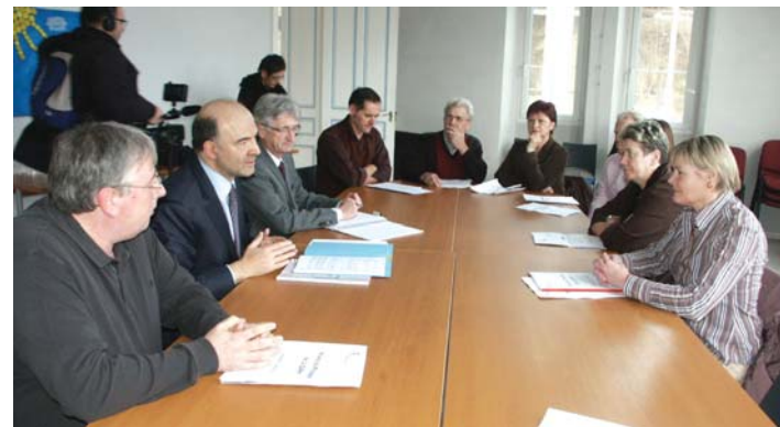
La rencontre a débuté par une réunion d'échanges en Mairie.

glober une zone industrielle moderne. Concernant l'aire d'accueil des gens du voyage, le Président de la CAPM a signalé que la collectivité a prévu dans son budget les aménagements sanitaires nécessaires ainsi que la réfection du grillage, de même que l'entretien du barrage de Belchamp, dans la lutte contre les inondations.