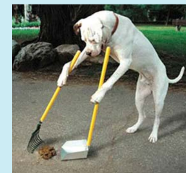
En attendant que les chiens ramassent eux-mêmes leurs déjections, c'est à leurs propriétaires d'agir !

En parallèle, Le Maire a pris un arrêté interdisant toutes déjections canines sur le domaine communal et obligeant les possesseurs de chiens à ramasser ces déjections. On pourra utiliser les sacs mis à disposition par la Municipalité dans les distributeurs, des équipements seront installés début mai rue des Ecoles (vieux cimetière) et à l'entrée de la rue des Combes. Dans les secteurs dépourvus de ces équipements, un simple sac plastique peut suffire : on place le sac sur la déjection, avant de retourner le sac et de mettre le tout dans une poubelle, adaptée de préférence. Parce qu'il est important de se responsabiliser, ensemble préservons nos espaces vie !